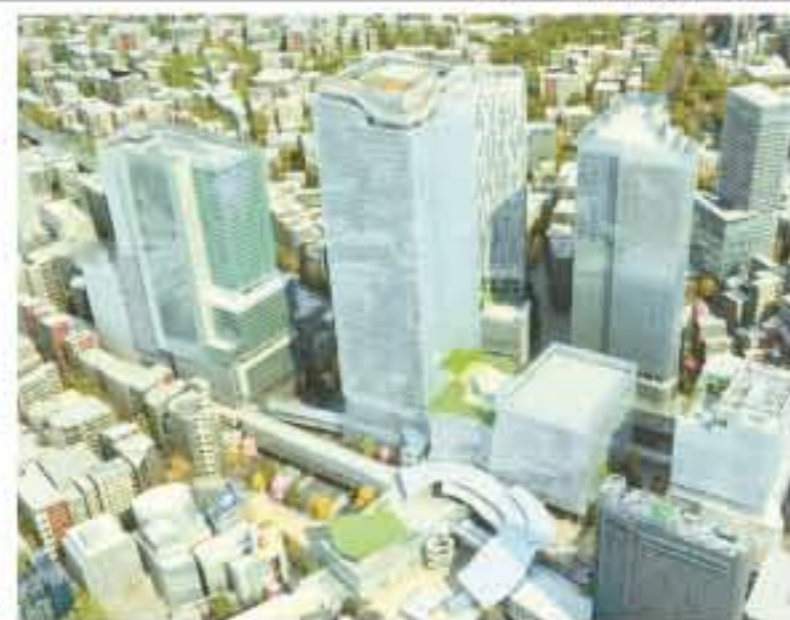
2027年の渋谷駅周辺のイメージ

12年の渋谷ヒカリエ工事を契機に、変貌を遂げているのが渋谷駅周辺だ。高層ビルでは現在、駅周辺の7つの再開発プロジェクトに始まり、4月28日には渋谷キャストが開業。東急電鉄JR、エンターテインメントシティへと生まれ変わる。