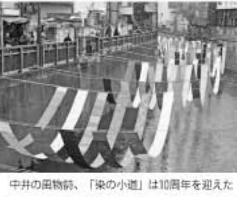
中井の団地前、「染の小道」は10周年を迎えた

新宿区は空家の実態を調べるため平成28年度(5~8月)に調査を実施。その結果を今一月に公表した。区内民間建築物4万8千7百88棟のうち、空家は1万1千1棟に上った。そのうち老朽化が著しいと判断される建築物が38棟、敷地内に廃棄物が散乱している空家棟数が11棟に上り問題がある建物も多々あることが判明した。 平成25年の「住宅・土」に関する地籍調査によると、今回の実態調査では新宿区の住宅総数は約23万5千戸。そのうち12万5千戸にあたる約53%が空き家となっている。これは前年調査の結果とほぼ同じで、空き家の増加が止まっていることがわかった。このうち、問題がある建物も多々あることが判明した。