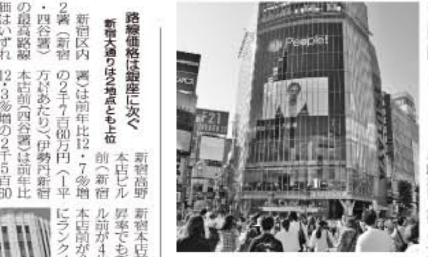
表参道駅西口交差点のQFRONT前

表参道駅周辺は、表参道駅西口から表参道駅東口にかけて、路線価が大幅に上昇している。これは、表参道駅周辺の再開発が進んでいることが要因と見られる。