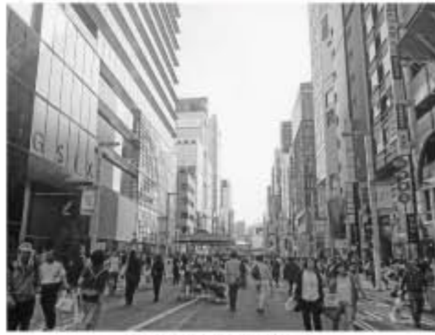
銀座の路線価は伸び悩んだ

都内全域の路線価は平均して、5年連続の上昇と見られる。ただし、表参道や歌舞伎町など、訪日客で溢れるエリアは、前年比で8%以上の上昇をみせた。一方で、周辺部では前年比で1%未満の上昇にとどまった。